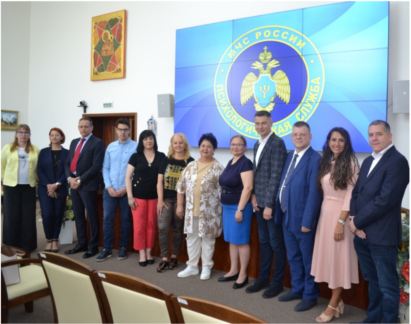
Министерство Российской Федерации по делам гражданской обороны, чрезвычайным ситуациям и ликвидации последствий стихийных бедствий © 2025