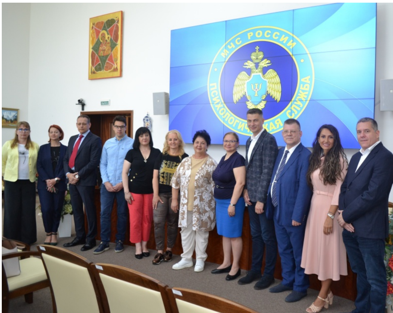
Министерство Российской Федерации по делам гражданской обороны, чрезвычайным ситуациям и ликвидации последствий стихийных бедствий © 2025